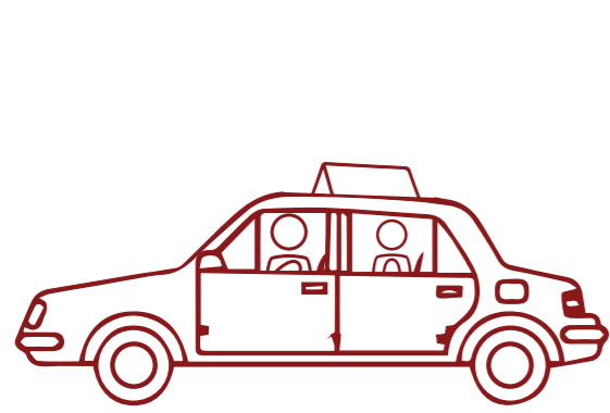
وسائل النقل المشتركة